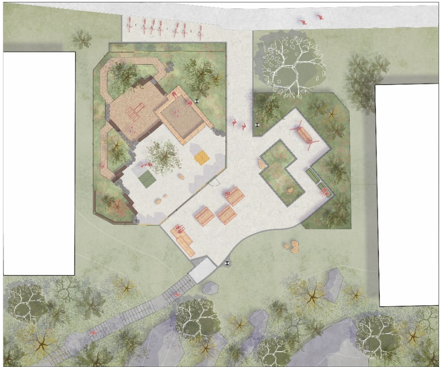
Figur 2 - Illustrationsplan som redovisar Disponentparkens planerade förnyelse. Illustrationsplanen med förklaringar bifogas även tjänsteutlåtandet.